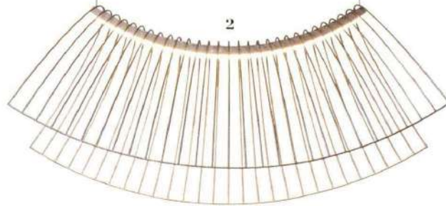
1. Porzellan-Leuchte „Dreamy Forest“ von Vezzini & Chen, P. a. A. 2. Stahldraht-Leuchte „Parabola“ von Roche Bobois, um 1240 €. 3. Aluminiumleuchte „Vesper Duo“ von Lee Broom, um 2200 €