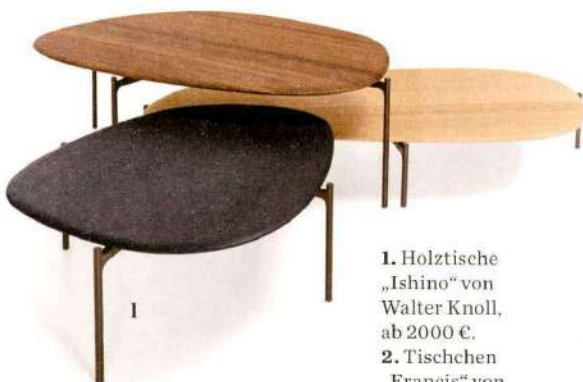
1. Holztische „Ishino“ von Walter Knoll, ab 2000 €. 2. Tischchen „Francis“ von Lema, P. a. A.

Trends, visionäre Designer und die Klassiker von morgen: All das haben wir auf der Design Week für Sie entdeckt!