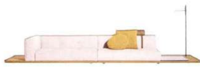
Insel-Sofa „Erei Zone“ auf Holzplatte, von De Padova, ab 6155 €