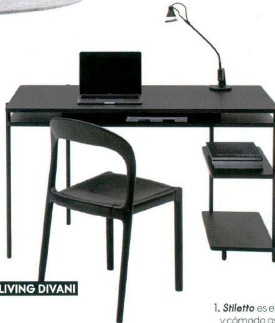
5- LIVING DIVANI