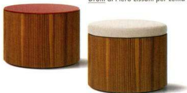
Drum di Piero Lissoni per Lema

AUTOSTRADA — Una carreggiata a due corsie, con tanto di curva, in tre diverse combinazioni di colori. E infinite possibilità compositive a caratterizzare il tappeto Autostrada di Poltronova, in lana tuffata a mano, nato in collaborazione con cc-tapis. Vera novità di quest'anno firmata Lapo Binazzi, ex membro del collettivo radicale UFO, prodotto per la prima volta nel 1990 viene rieditato in occasione del Fuorisalone. poltronova.it DRUM — Struttura portante in legno cannettato, lavorato a toro in massello di noce canaletto per la famiglia di tavolini creata da Piero Lissoni per Lema. A cilindro, ovali, ma anche quadrati, possono avere il piano in vetro verniciato, in marmo o trasformarsi in un pouf grazie all'aggiunta nella parte superiore di un cuscino in tessuto o pelle. lemamobili.com M.B.