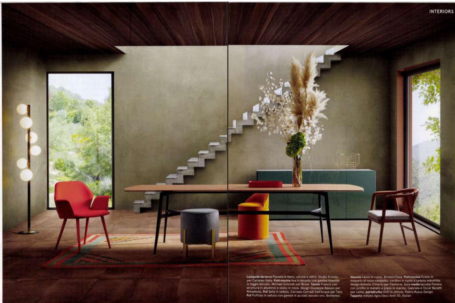
Lampada da terra Planefa in ferro, ottone e vetro. Studio Kronos per Cattelan Italia. Poltroncina Ava in tessuto con gambe rivestite in faggio laccato. Michael Schmidt per Bross. Tavolo Francia con struttura in alluminio e piano in noce, design Giuseppe Savio per Rimadesio. Puf Sella in velluto, Corrado Corradi Dell'Acqua per Tolo. Puf Puffoso in velluto con gambe in acciaio laccato oro, Bontempi.