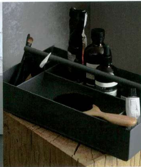
El aparador Ortelia, de Marelli & Molteni para Lema (izquierda), apuesta por la pureza y el equilibrio, prescindiendo de los elementos decorativos. A la derecha, una solución muy eficaz para mantener ordenados los productos cosméticos.