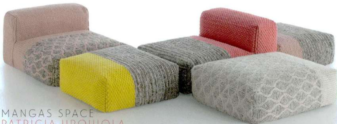
MANGAS SPACE PATRICIA URQUIOLA

Un concepto inédito y rico en facetas, texturas y tonalidades. Consta de alfombras, módulos, pufs y cojines creados por Patricia Urquiola para GAN.