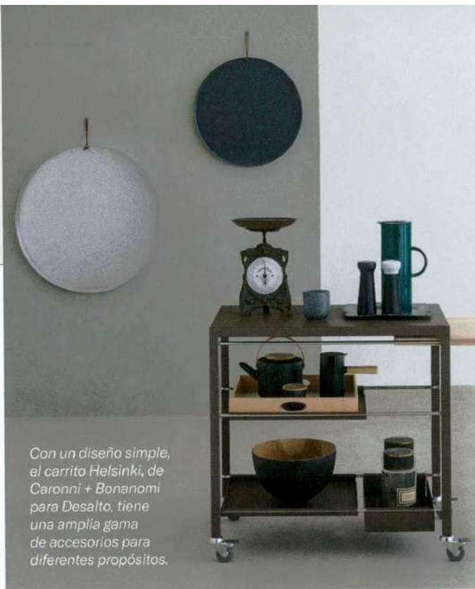
Con un diseño simple, el carrito Helsinki, de Caronni + Bonanomi para Desalto, tiene una amplia gama de accesorios para diferentes propósitos.