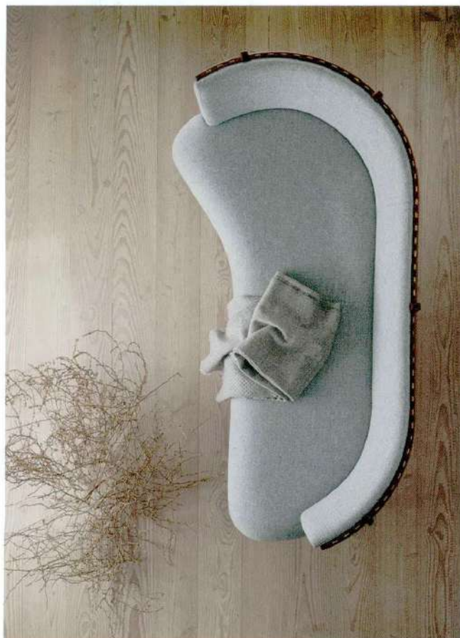
VENISE GABRIELE & OSCAR BURATTI

Lema estrena este sofá modular de gran versatilidad estética y formal diseñado por Gabriele & Oscar Buratti. Venise responde a las demandas de relajación y convivencia indistintamente. Contemporáneo, de formas muy elegantes y con una gran profundidad de asiento. Con detalles propios de alta costura y gran riqueza de variables de composición y geometría.