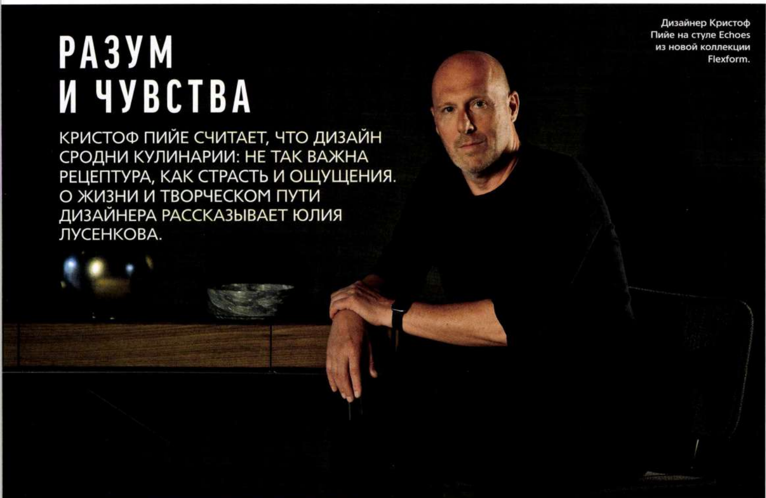
Консоль из шпона ореха каналетто и нержавеющей стали Any Day, Flexform.

Дизайнер Кристоф Пийе на стуле Echoes из новой коллекции Flexform.