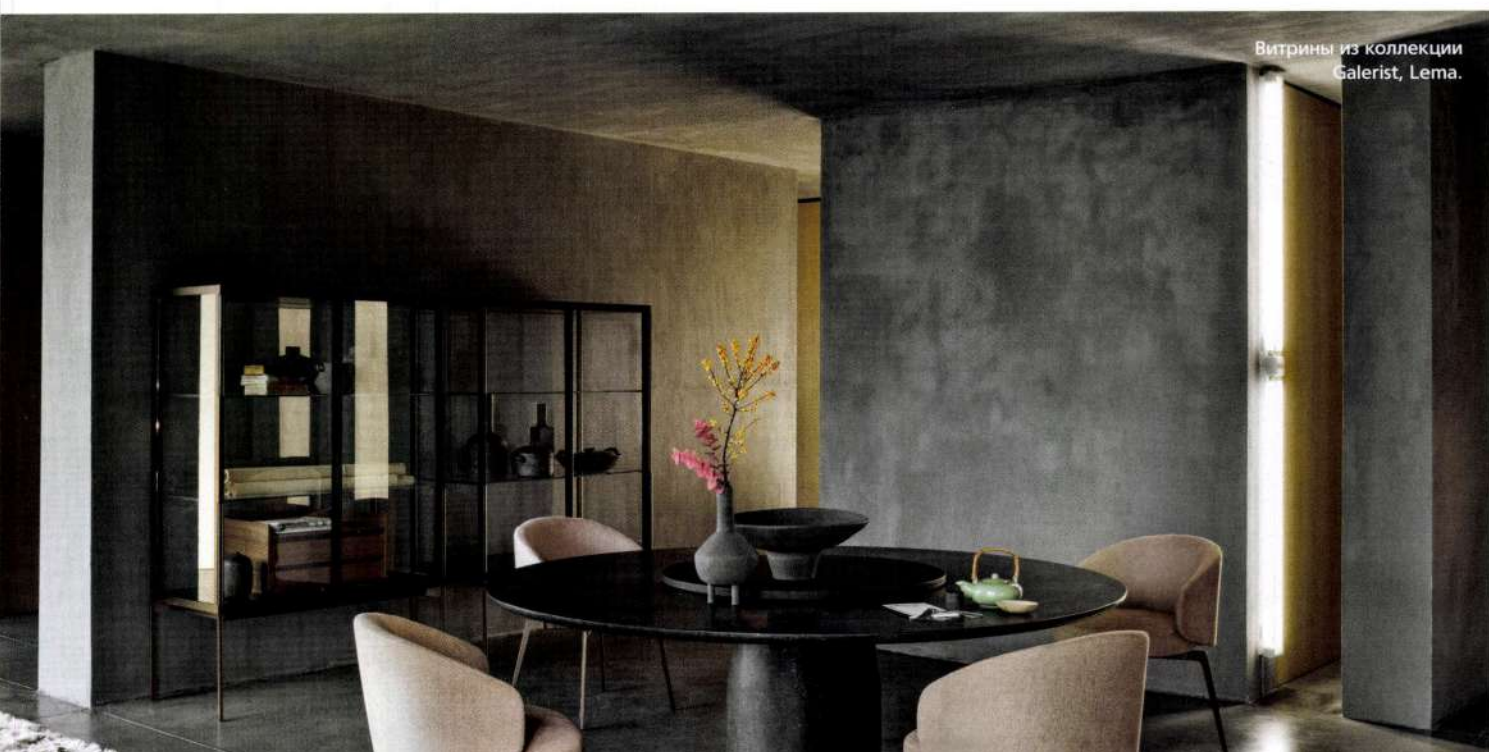
Витрины из коллекции Galerist, Lema.

МНЕ НРАВИТСЯ РАБОТАТЬ С ИТАЛЬЯНЦАМИ – ОНИ ФОНТАНИРУЮТ ИДЕЯМИ И ПОСТОЯННО ИМПРОВИЗИРУЮТ, СОЗДАВАЯ ЧТО-ТО НОВОЕ.