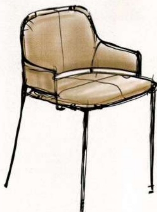
Один из эскизов для Flexform.

На мой вопрос, с чего начинается дизайн, Кристоф отвечает философски: "С вопроса "зачем это нужно?" Он считает, что в мире уже почти все создано, да и вообще человек в быту неприхотлив – сейчас люди ценят качественные вещи и интересуются историей их создания. "Дизайн – это в первую очередь люди. Вот, например, я получил приглашение от Flexform и ни минуты не думал – мне очень импони-