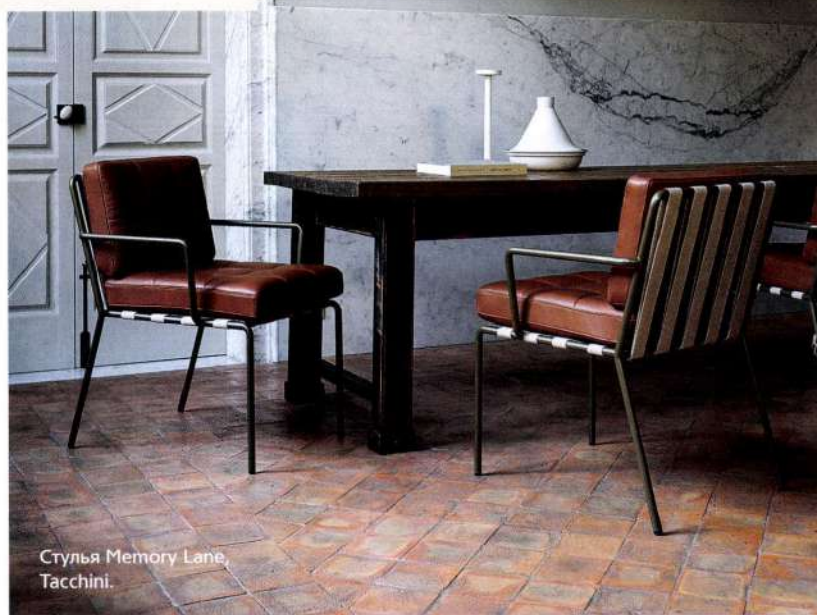
Стулья Memory Lane, Tacchini.

МНЕ НРАВИТСЯ РАБОТАТЬ С ИТАЛЬЯНЦАМИ – ОНИ ФОНТАНИРУЮТ ИДЕЯМИ И ПОСТОЯННО ИМПРОВИЗИРУЮТ, СОЗДАВАЯ ЧТО-ТО НОВОЕ.