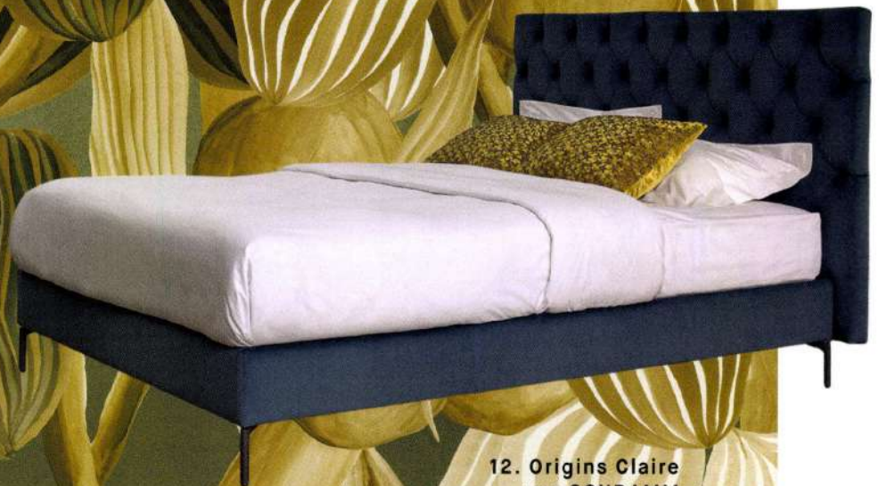
12. Origins Claire von SCHRAMM Die klassische Knopfheftung des Kopfteils wirft charakte- ristische Falten, die Rauten- form unterstreicht die hohe Kunst der Polsterung