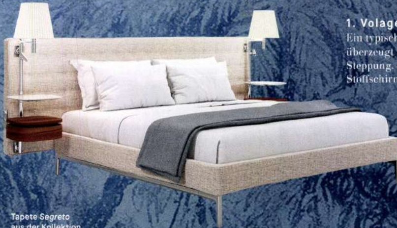
Tapete Segreto aus der Kollektion GlamFusion von GLAMORA

Poetische Bettentwürfe, zarte FARBTÖNE und schmeichelnde Materialien: Diese RUHESPENDER sind zu schön, um sie zu verschlafen